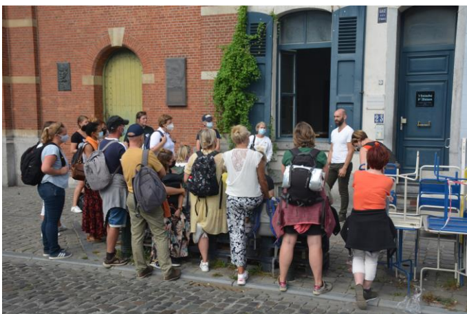
Bij de vzw Vrienden van het Huizeke aan het Vossenplein.

onze gastvrijheid niet louter materieel kan zijn : het essentieelste is het hart.