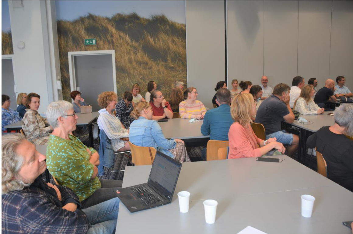
Deelnemers aan de starttweedaagse van het Vicariaat onderwijs en de pedagogische begeleiding op 1 september 2021.